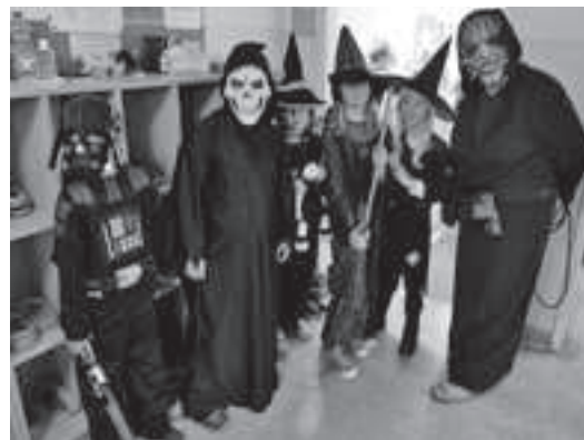
beim Hexenfest ging es gruselig zu...