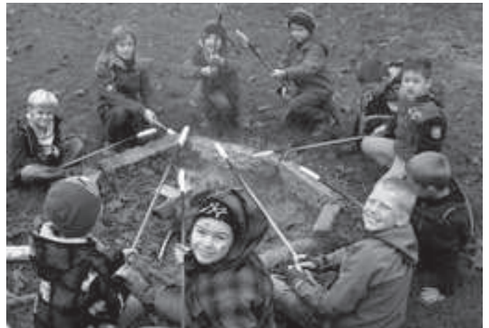
schön warm und dann noch lecker – Knüppelkuchen