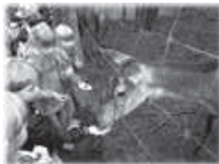
Die Kinder & Erzieherinnen der 1. Klassen vom Kinderhaus Fantasia