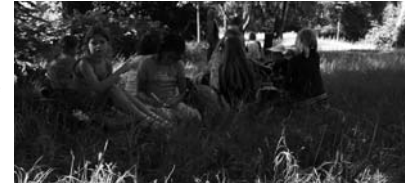
Klasse 2b – Grundschule Schwanebeck

nigen Wiese, und die Mädchen konnten dort auch noch ein paar Pferde streicheln. Als wir wieder in der Schule waren, wollten wir nur noch sitzen.